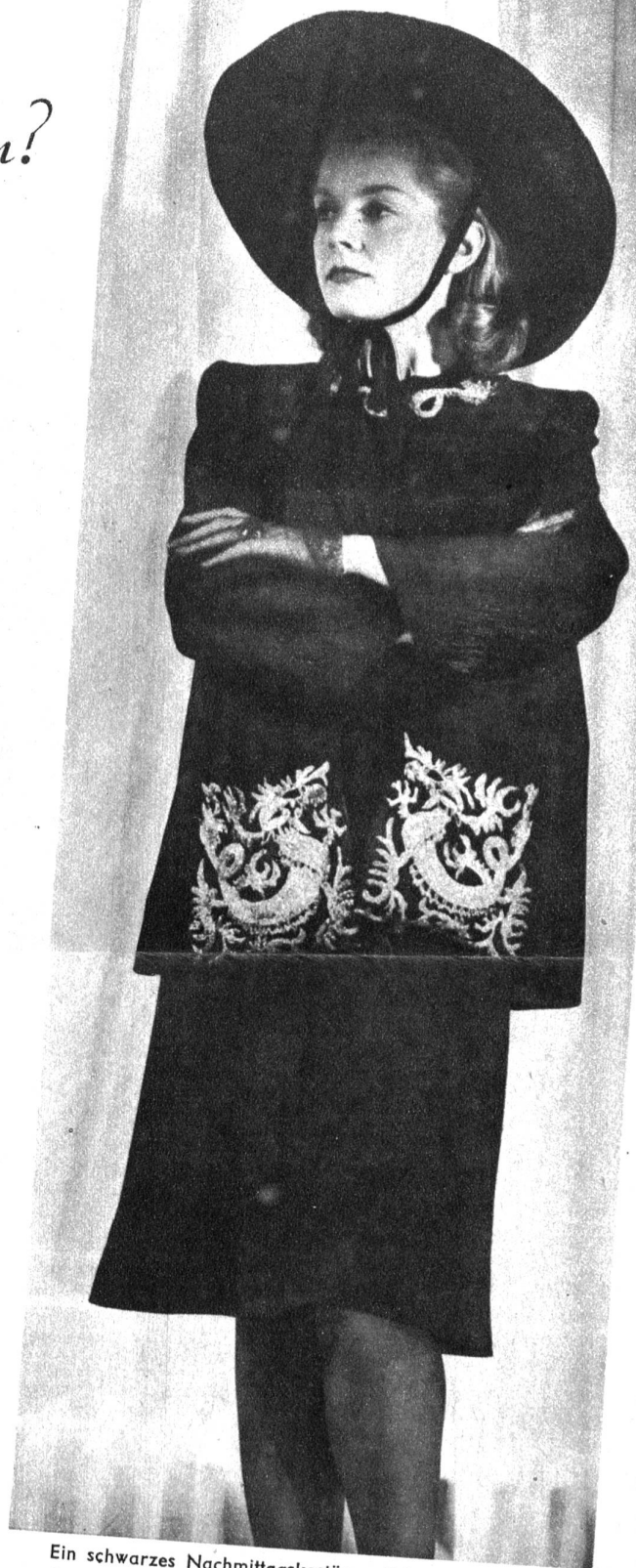
Ein schwarzes Nachmittagskostüm mit loser Jacke und Goldstickerei in chinesischen Ornamenten als Taschenverzierung