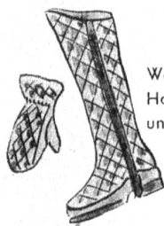
Wattierte Handschuhe und Gamaschen