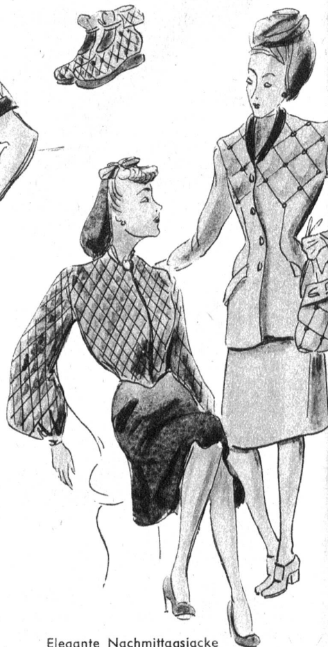
Elegante Nachmittagsjacke und Phantasietailleur