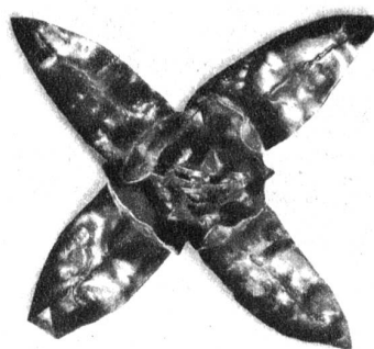
Handgeschmiedete Brosche aus Kupfer