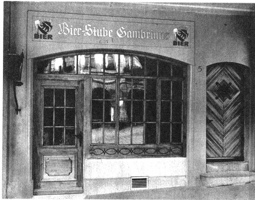
Die neue Bier-Stube Gambrinus in der Gerechtigkeitsgasse