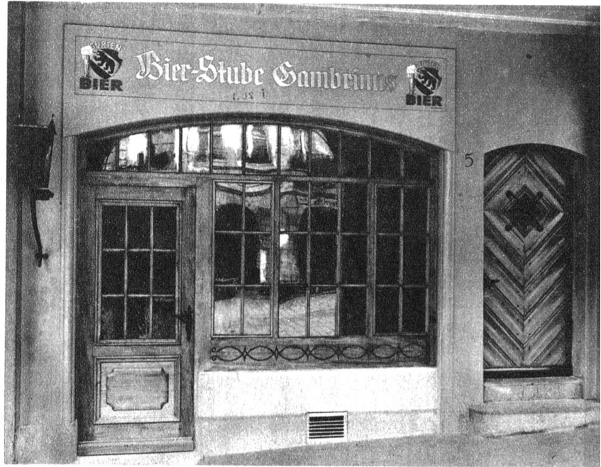
Die neue Bier-Stube Gambrinus in der Gerechtigkeitsgasse

Entwurf, Pläne und Bauleitung A. BERGER, ARCHITEKT, BERN