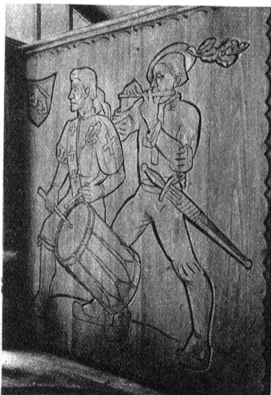
Links: Berner Trommler und Pfeifer, ausge- führt von den Malern und Bildhauern Ge- brüder Waser