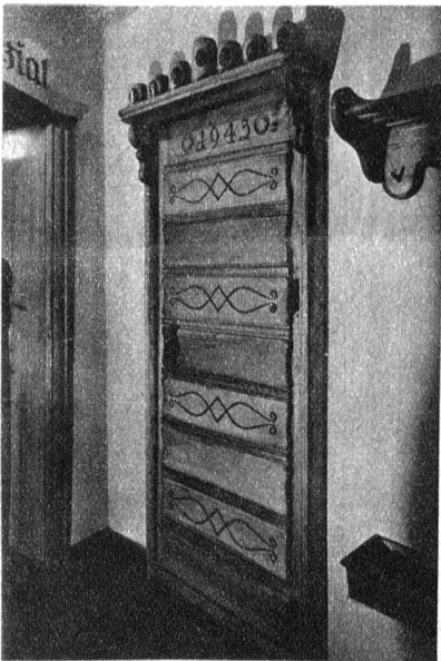
Eine wirkungsvoll gestaltete Türe