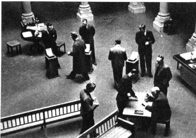
Wahltag – Festtag der Demokratie