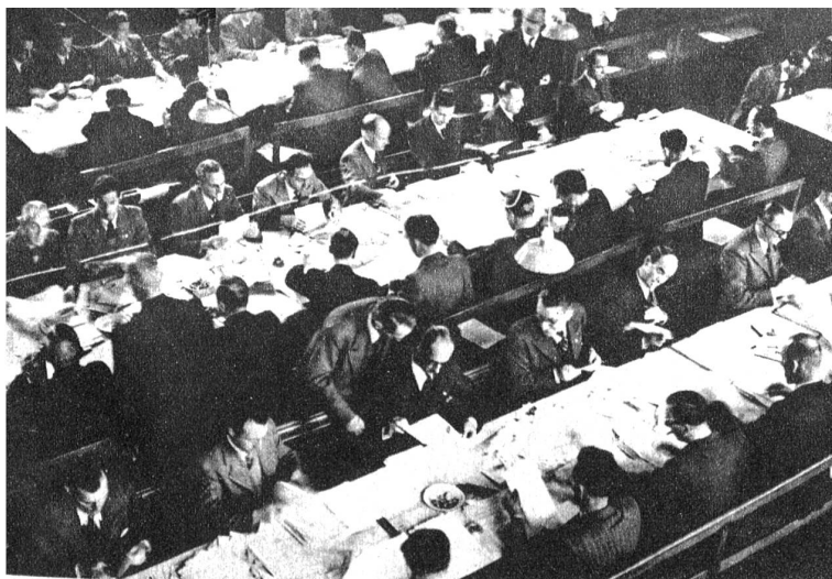
Nach den Wahlen herrscht in den Wahlbüros beim Auszählen der eingelegten Stimmzettel eine eilige Tätigkeit, die sich auf mehrere Tage und Nächte erstreckt. Unser Bild zeigt diese Arbeit in Bern, wo nicht weniger als 13 verschiedene Listen eingelegt wurden und 33 Nationalratssessel besetzt werden mussten.