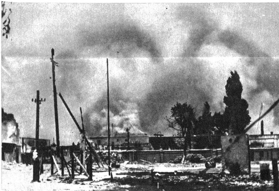
Links: Die Taktik der «versengten Erde» wird von den Deutschen auf ihrem Rückzug in der Ukraine möglichst resillos verwirklicht. «Planmässig geräumt» schreibt eine deutsche Bildstelle zu dieser Aufnahme, welche das durch Sprengungen völlig zerstörte Areal eines Eisenbahnknotenpunktes zeigt