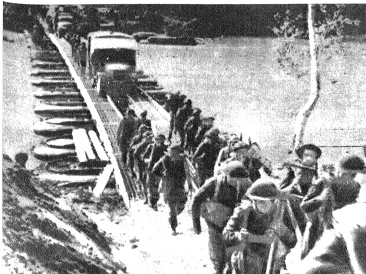
Unten links: Der Sieg der 5. Armee am Volturno wurde mit dem Einsatz modernster technischer Hilfsmittel errungen. Sofort nach der Sicherung der Brückenköpfe schritten die Pioniere zum Bau von Notbrücken. Unser Bild zeigt eine dieser Pontonbrücken aus Gummi-Pontons und zusammensetzbaren stählernen Fahrgeleisen, die den Nachschub von Kriegsmaterial ermöglichen (Funkbild)