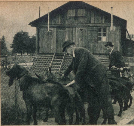
Bevor die Tiere zur Ausstellung zugelassen werden, untersucht sie der Platzarzt auf ihren Gesundheitszustand