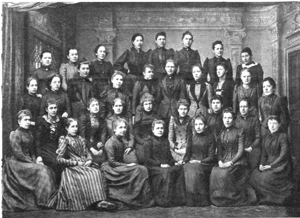
Die Seminar-klasse III der Mädchensekundarschule Bern 1890