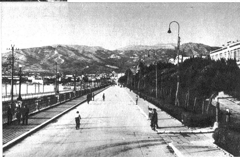
Vier Jahre nach der Kriegserklärung Englands an Deutschland haben englische Truppen auf dem europäischen Festland wieder Fuß gefasst. Zwei Tage nach Beginn der Operationen waren sie im Besitze von Reggio di Calabria