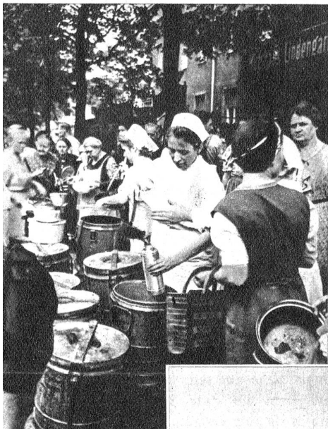
Links: Verpflegungsdienst in Berlin nach einem Bombenangriff. Die Bevölkerung erhält in erster Linie eine warme Mahlzeit und heißen Kaffee