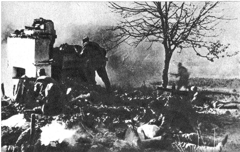
Halbwegs zwischen Taganrog und Mariupol haben die Russen nach der Einnahme von Taganrog eine neue Frontlinie errichtet um den deutschen Rückzug zu stören. Die russische Sanität folgt bis in die vorderste Linie