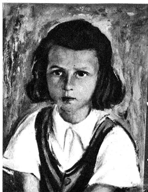
Links aussen: Alter Winzer