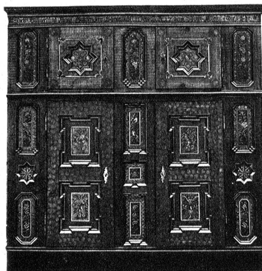
Rechts: Derselbe nach der Restaurierung