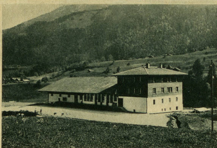
Das neue Abfüll- und Lagerhaus in Weissenburg