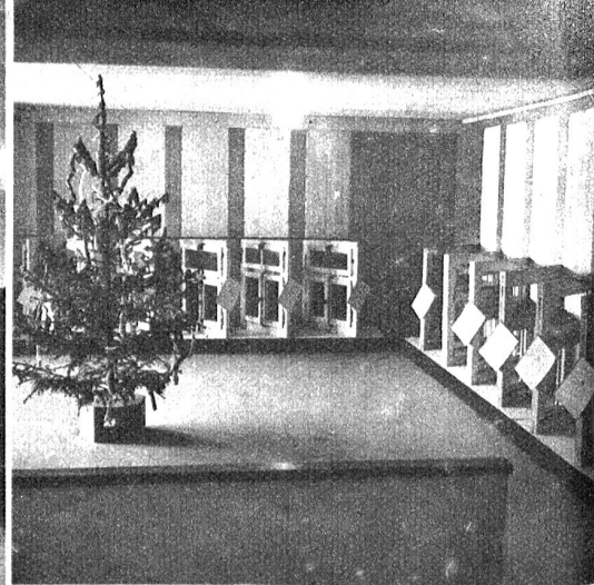
Teilansicht der Ausstellung, Arbeiten der Bauschreiner-Lehrlinge