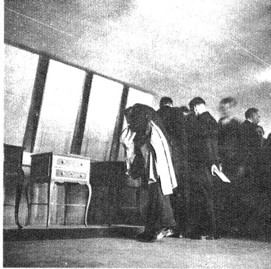
Die Ausstellung war von zahlreichen Interessenten besucht