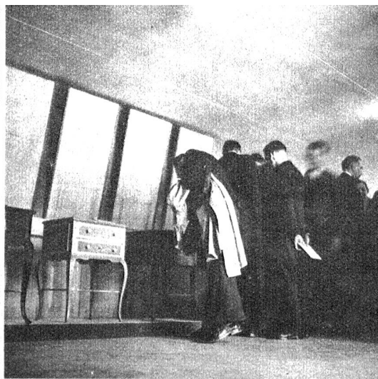
Die Ausstellung war von zahlreichen Interessenten besucht