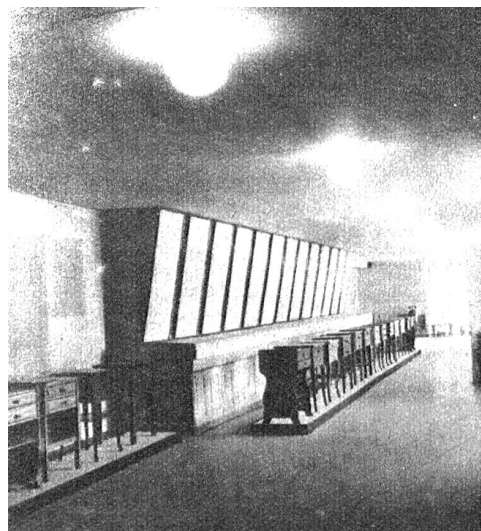
Ausstellung der Möbelschreiner-Lehrlingsarbeiten