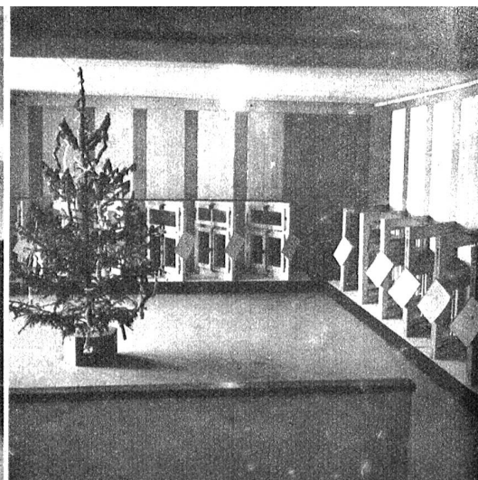
Teilansicht der Ausstellung, Arbeiten der Bauschreiner-Lehrlinge