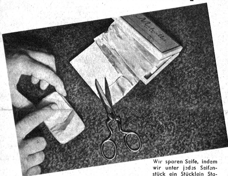
Wir sparen Seife, indem wir unter jedes Seifenstück ein Stücklein Stanniol kleben