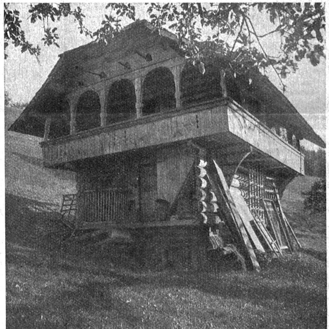
Ein bernischer Speicher

Wenn die beiden aber geglaubt hatten, die schlanke Schwarze, die sich Mary nannte, hätte diesen Blick nicht gesehen, so war das eine gründliche Täuschung. Trotzdem liess sich die Angelegenheit gut an. Mary erwies sich als äusserst schlagfertig und hatte eben dazu angesetzt, den beiden Männern in ihrer originellen Art einige Grundregeln des Nachtlebens auseinanderzusetzen, von dem sie, nebenbei festgestellt, fand, dass es eigentlich immer ein grosser Bluff sei und nie das halte, was es verspreche — als plötzlich die Türe rasch und weit aufgerissen wurde und einem verwegenen ausschauenden Burschen Einlass gewährte, der mit raschen, entschlossenen Schritten der „Bar“ zusteuerte und schon von weitem die Hand nach einem Glase puren Whiskys ausstreckte, das der Mixer rasch eingefüllt hatte und ihm entgegenhielt. „Abend, Bret!“ sagte der Mixer in vertraulichem Ton.