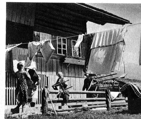
Bild rechts: Inzwischen klopfen die Mutter mit den Töchtern draussen auf den Wiesen tüchtig das Bettzeug

Bild links: Auch die Bilder werden gründlich abgestaubt