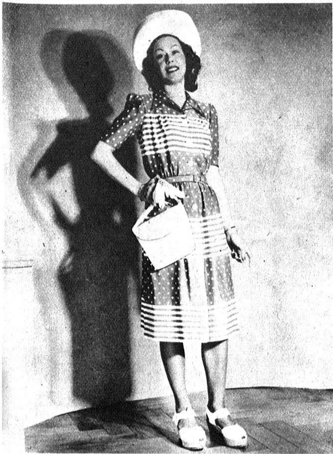
Fröhliches Sommerkleid in Tupfen und Streifen, in verschiedenen Modefarben