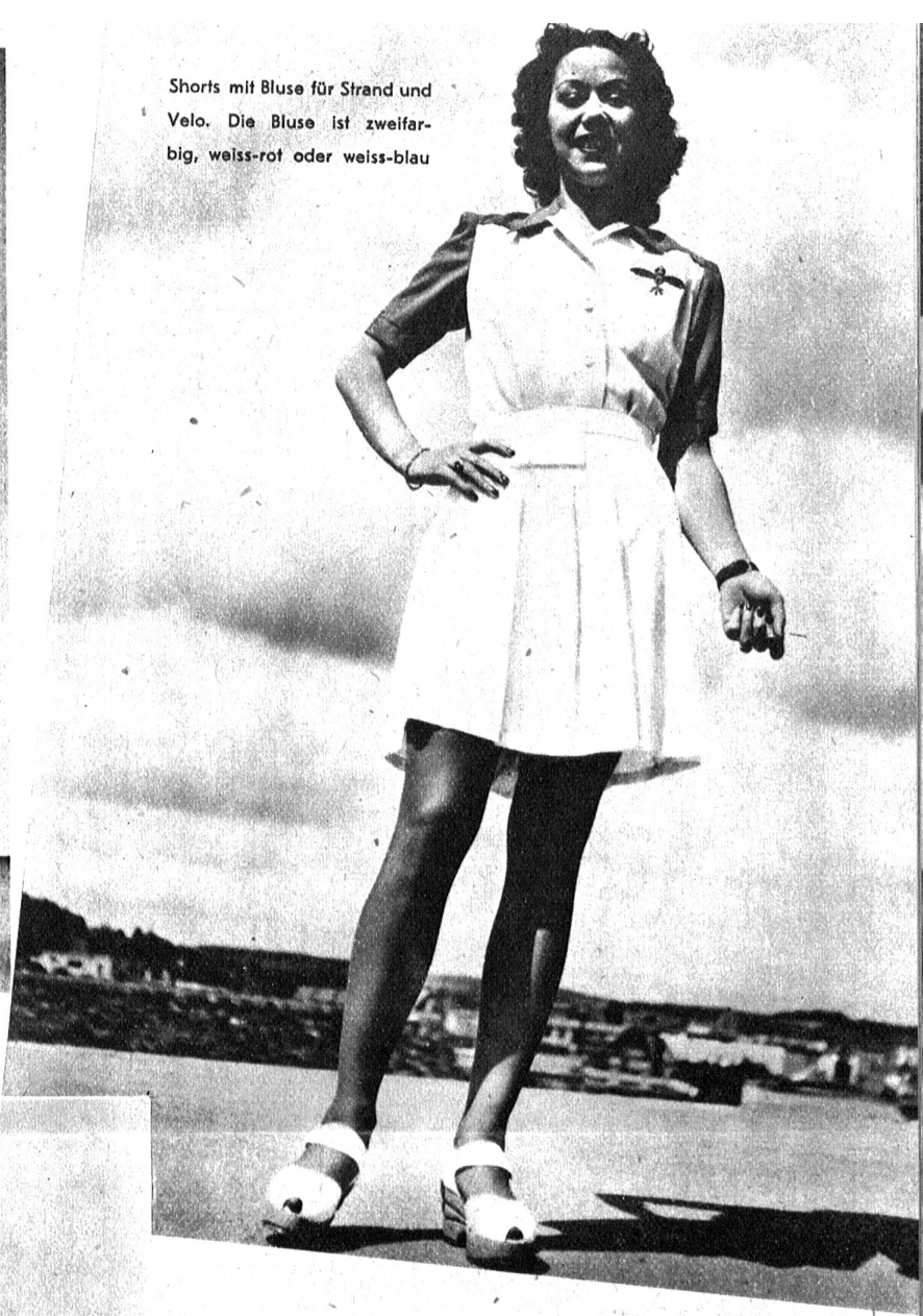
Shorts mit Bluse für Strand und Velo. Die Bluse ist zweifar- big, weiss-rot oder weiss-blau