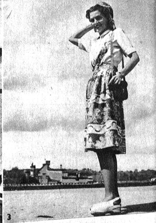
1 Apartes Strandkleid mit gestreiftem Oberteil, Jupe und Tasche und getupfter Hose, Schirm und Kappe 2 Elegantes Imprimé in jugendlicher Form, dunkelblau-weiss 3 Trägerjupe im Heimatstil mit dazu passender Bluse und Kopftuch (in allen Farben)

Das schöne und warme Frühlingwetter hat allgemein den nachhaltigen Wunsch nach Ferien, Sonne und ein klein wenig Freude wachgerufen. Die von der Berner Firma Gebr. Loeb in ihren Räumen veranstaltete Modeschau hat gerade in diesem Punkte durch die geschmackvolle Zusammenstellung der neuen Modelle die Erwartungen der zahlreichen Besucher übertroffen. Vom aparten Strandkleid bis zum eleganten Nachmittagskleid wurden in bunter Reihe die schönsten Neuschöpfungen gezeigt, die in jeder Beziehung auch den