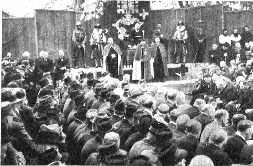
Rund 2000 Stimmberechtigte des Standes Nid dem Wald waren am Sonntag im Ring zu Stans vereinigt, um die Sach- und Wahlgeschäfte für ein Jahr zu bestellen.