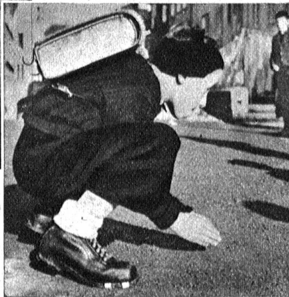
Ob er wohl trifft?