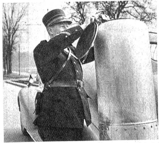
Kontrolle, ob der Generator auch wirklich im Betrieb ist. Um sicher zu sein, werden die Gase mit einem Streichholz zur Explosion gebracht