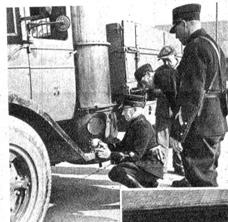
Bremskontrolle. Anbringen des Bremsprüfapparates