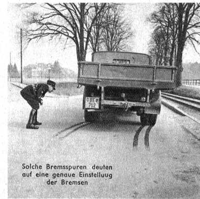
Solche Bremsspuren deuten auf eine genaue Einstellung der Bremsen

Ausrüstung, sah man auch zwei Radfahrer, die sich beim Erblicken der Kontrolle durch die Flucht derselben entziehen wollten. Für Ausreisser hat die Polizei aber besonders scharfe Augen. Sie wurden mittelst eines Dienstmotorrades eingeholt und zur Kontrolle zurückgeführt. Auch hier ergab diese, dass sich die Fahrräder nicht in betriebsicherem Zustande befanden. Sämtliche Mängel der beanstandeten Fahrzeuge wurden in ein besonderes Kontrollbuch eingetragen. Ein Doppel wurde dem Fahrer übergeben mit der Aufforderung, das Fahrzeug innert festgesetzter Frist instandstellen zu lassen und es dem Polizeiposten des Wohnorts zur Nachkontrolle vorzuführen. Zudem hat er in jedem Falle noch eine Busse zu gewärtigen. — Man konnte sich bei dieser Kontrolle über-