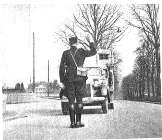
Anhalten bitte, Fahrzeugkontrolle!