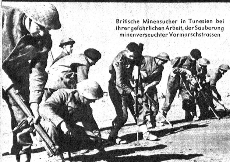
Britische Minensucher in Tunesien bei ihrer gefährlichen Arbeit, der Säuberung minenverseuchter Vormarschstrassen