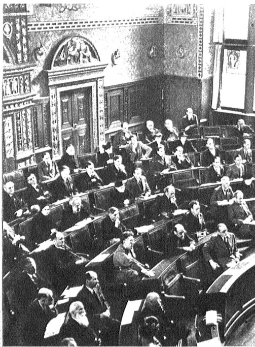
Der schweizerische Schriftstellerverein hielt am letzten Wochenende in Basel seine Jahrestagung ab. Dieses Zusammentreffen hat gerade heute seinen tieferen Sinn: die Wahrung der Geistesfreiheit