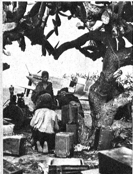
Kaktusbäume dienen an der tunesischen Front als vorzüglicher Tarnschutz für Flugzeuge