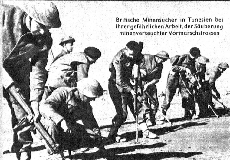
Britische Minensucher in Tunesien bei ihrer gefährlichen Arbeit, der Säuberung minenverseuchter Vormarschstrassen