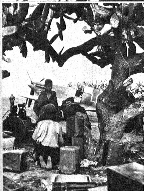
Kaktusbäume dienen an der tunesischen Front als vorzüglicher Tarnschutz für Flugzeuge