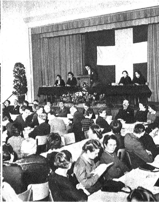
Zum 25jährigen Jubiläum der „Kolleginnen“ im Schweiz. Kaufmännischen Verein veranstaltete derselbe in Basel eine Jubiläumsfeier. Unser Bild zeigt die Präsidentin der weiblichen Mitglieder, Fräulein Imhof, am Rednerpult