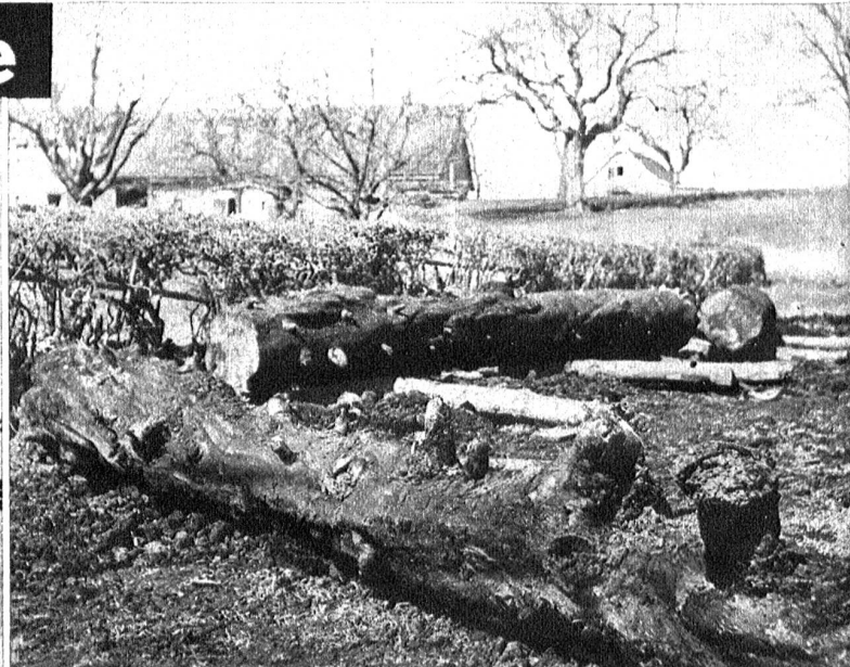
Oben: Bei Drainage-Arbeiten in der Nähe von Sankt Gallen ist man auf die Ueberreste eines prähistorischen Waldes gestossen. Dabei wurde ein vollständig erhaltener Tannenbaum aufgedeckt, der wohl etliche tausend Jahre in Torf und Lehm gebettet lag