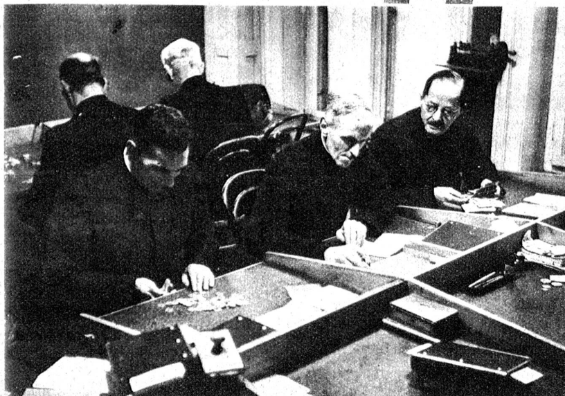
Von 17 Uhr an, wenn die Tour beendet ist, sitzen die Einzieher im Bureau bei der Abrechnung