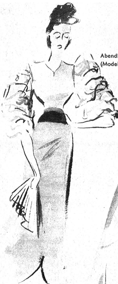
Abendkleid (Modell Gaby Jouval)