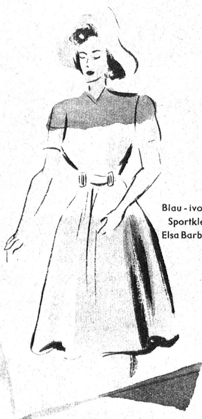
Blau - ivoire - braunes Sportkleid (Modell Elsa Barbéry, Lugano)