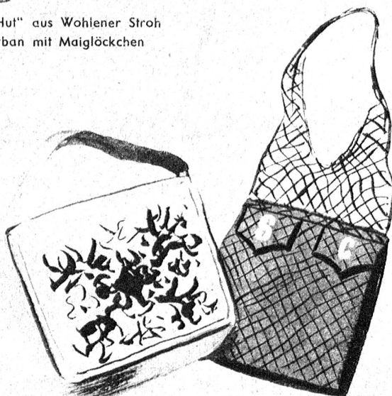
Schöne bestickte Tasche