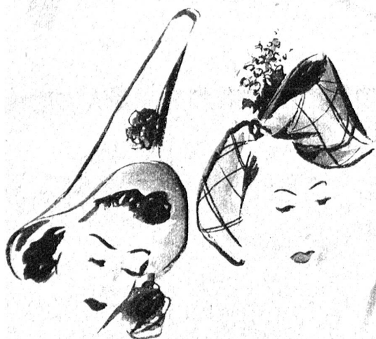
Der „Minnesänger-Hut“ aus Wohlener Stroh und ein Seidenturban mit Maiglöckchen