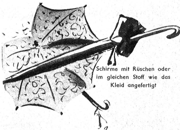
Schirme mit Rüschen oder im gleichen Stoff wie das Kleid angefertigt