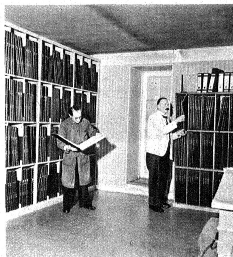
In diesem Raume werden die Steuerregister während 10 Jahren aufbewahrt