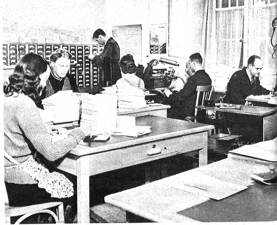
In diesem Bureau werden rund 79 000 Einschätzformulare adressiert und versandbereit gemacht