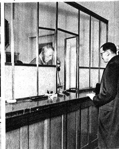
Am Schalter der Stadtkasse werden zum Teil die Steuern einbezahlt, doch werden hier von der Stadtverwaltung auch die Gelder bezogen, die sie zur Erledigung der laufenden Geschäfte benötigt.