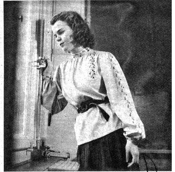
Diese Rohseidenbluse in Naturfarbe ist in der sog. Russenkittelform gearbeitet. Besonders apart wirkt hier die Stickerei in schönem Braun und Gelb.

Die Blusen sind unbestreitbar das beliebteste Kleidungsstück der Frauen, sie haben nie zu viel davon und sind immer glücklich über eine Neuerwerbung. Doch die Bluse ist auch wirklich etwas Praktisches, denn mit ihrer Hilfe kann man den ganzen Tag gut und richtig angezogen sein; sie lässt sich am Morgen ebenso gut wie am Nachmittag oder Abend tragen. Die moderne Bluse, die meistens chemiseförmig gearbeitet ist, wirkt wohl etwas streng, wird sie aber mit einer schönen Stickerei verziert, so gewinnt sie sofort an fraulichem Charme und beionter Eleganz. Sympathisch wirken die Buntstickereien, die den Uniblusen eine fröhliche und jugendliche Note verleihen. Mit nur wenig Arbeitsmitteln und ein bisschen Geduld lassen sich dabei Effekte erzielen, die einen überraschenden Erfolg zeitigen. Neben den Stickereien können aber auch Hohlsäume sehr zur Bereicherung der Blusen beitragen und erst mit deren Hilfe werden sie zum eleganten Kleidungsstück gestempelt.