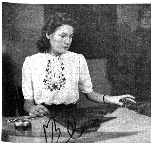
Jugendliche Bluse aus weisser Seide mit bunter Stickerei am Vorderteil. Ein Bündchen zum Binden bildet den Halsabschluss.