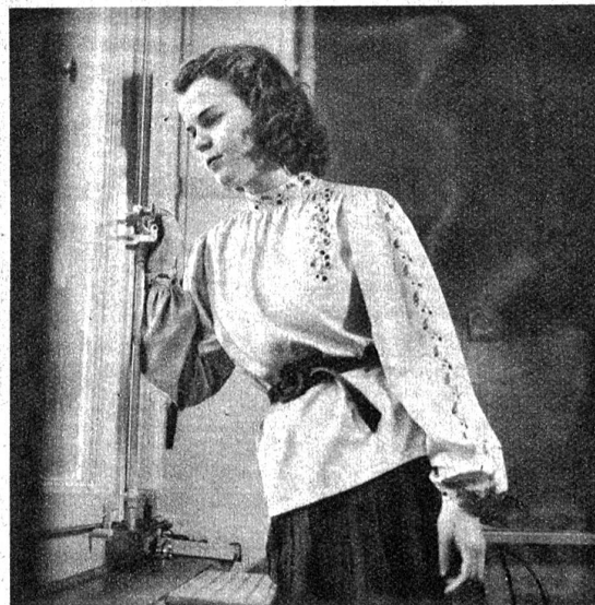
Diese Rohseidenbluse in Naturfarbe ist in der sog. Russenkittelform gearbeitet. Besonders apart wirkt hier die Stickerei in schönem Braun und Gelb.