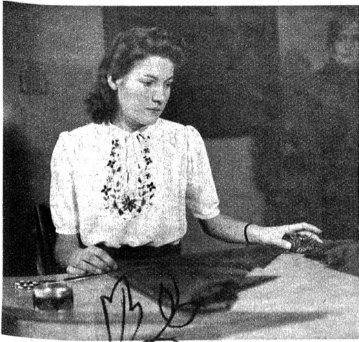
Jugendliche Bluse aus weisser Seide mit bunter Stickerei am Vorderteil. Ein Bündchen zum Binden bildet den Halsabschluss.