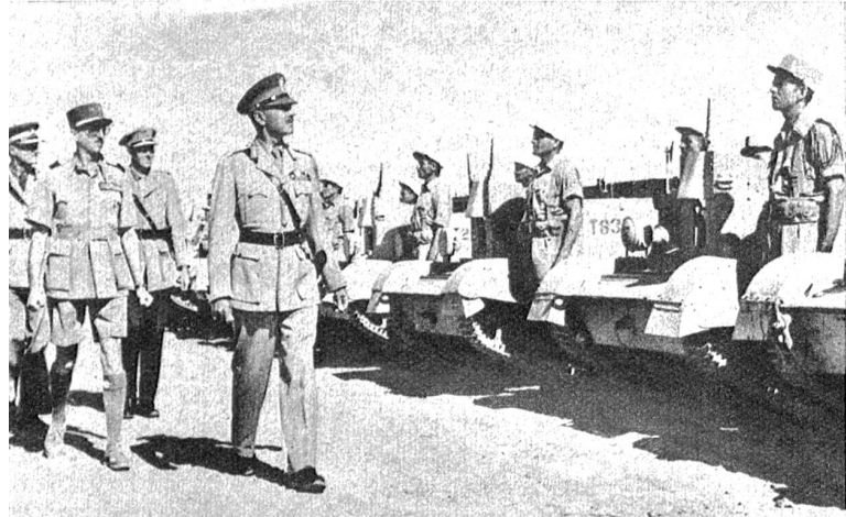
Oben: General Anderson inspiziert französische Panzertruppen in Tunis