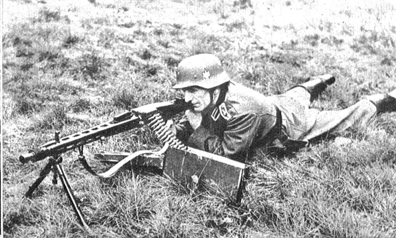
Oben: Neues deutsches Maschinengewehr. Wie zuerst von russischer Seite gemeldet wurde, verwenden die deutschen Stosstruppen an der Stalingradfront neue Feuerwaffen, unter denen das Maschinengewehr, das 3000 Schuss pro Minute feuert, besonderes Aufsehen erregt. Mit dieser unheimlichen Geschwindigkeit, nämlich 50 Schuss pro Sekunde, wird eine Feuerschicht von unheimlicher Kraft erreicht