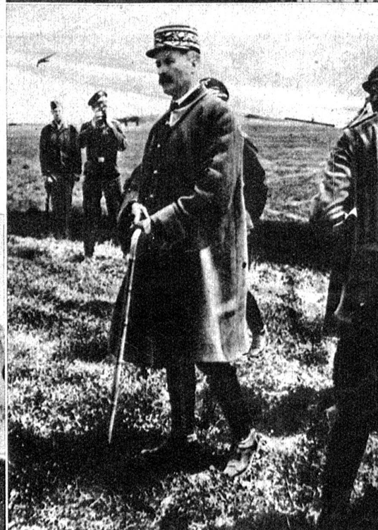
Der in Algier nach dem plötzlichen Tode Darlans zusammengetretene französische Kolonialrat hat General Giraud einstimmig zum Nachfolger Darlans als Hochkommissar von Französisch-Afrika gewählt (ATP)