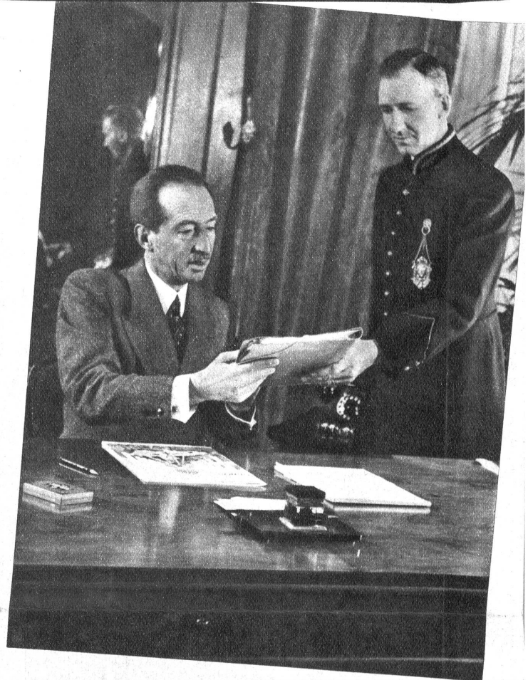
Rechts: Der Bundespräsident in seinem Arbeitszimmer im Post- und Eisenbahndepartement. Hier überreicht ihm der Bundesweibel ein umfangreiches Aktendossier

In der Dezembersession der Eidg. Räte werden die Wahlen des Ratspräsidenten für das Jahr 1943 vorgenommen. Der derzeitige Vizepräsident des Bundesrates, Dr. Enrico Celio, wird als Nachfolger von Dr. Philipp Etter zum Bundespräsidenten gewählt