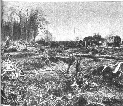
Links: Moderne Walddrodungsmethoden, die als Beispiel für alle in der Schweiz im Zuge des Mehranbaues vorgesehenen Walddrodungen dienen, kommen bei Langenthal zur Anwendung, wo mit den neuesten Spezialmaschinen 21 ha Wald umgelegt werden, um den Boden dem Ackerbau zu erschliessen