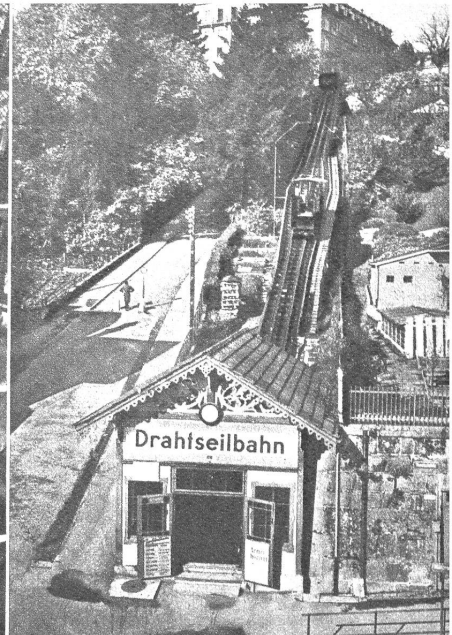
Das ist die kürzeste Bahn der Schweiz. Sie fährt in 80 Sek. von der Bundeshausterrasse ins Marzili hinunter. Bundesräte gehören zu ihren hohen Gästen. Kinder und Hunde haben freie Fahrt