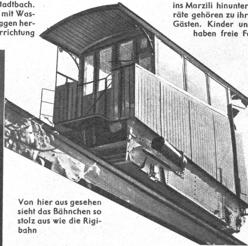
Von hier aus gesehen sieht das Bähnchen so stolz aus wie die Rigi-bahn