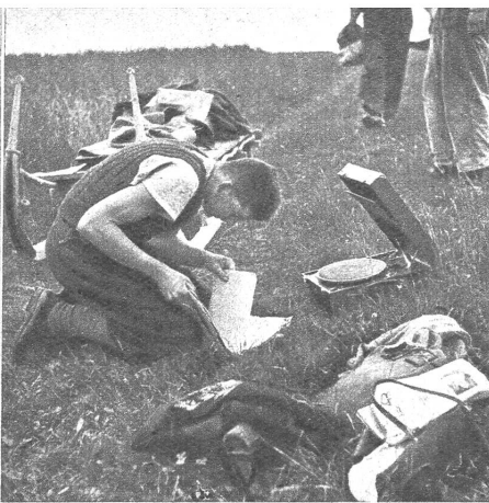
Der Jazzfanatiker mag nicht warten, bis der Grammo am Ort ist, schnell wird der neueste Schlager aufgelegt