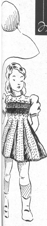
Kinderkleidchen für 2–3jährig