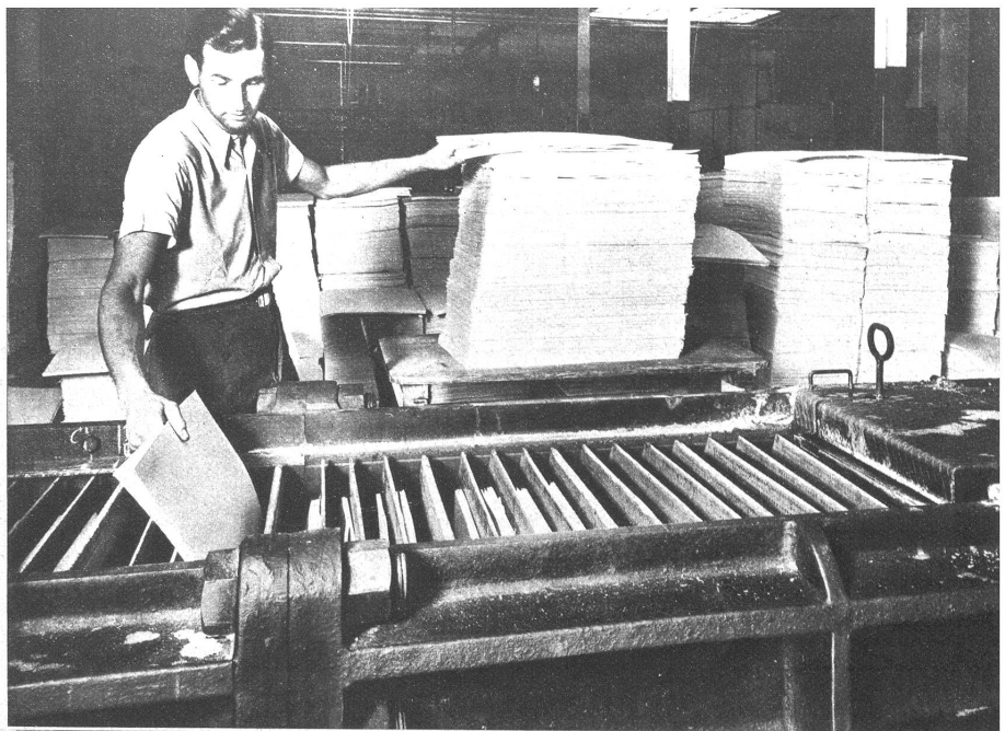
Die Zelluloseblätter werden in den flüssigen Zustand übergeführt

Ausgangsstoff für die Zellwollherstellung ist die Zellulose, die aus dem Nadelholz nordischer Wälder gewonnen wird. Aus Zellulose besteht übrigens auch die Substanz aller anderen pflanzlichen Textilrohstoffe, der Baumwolle, des Flachses, des Hanfes — eine Tatsache, an die sich der Laie bei der Beurteilung der Zellwolle zumeist nicht erinnert. Um aus der Zellulose spinnbare Zellwollfasern herzustellen, muss diese zunächst einmal in flüssigen Zustand übergeführt werden — ganz gleich, wie es zum Zwecke der Kunstseidenerzeugung geschieht. Die Verflüssigung geht unter der Einwirkung von Natronlauge und Schwefelkohlenstoff vor sich. Doch bevor die Flüssigkeit, Viscose genannt, durch Düsen gepresst und im Fällbad feste Faserform annehmen kann, wird sie filtriert und macht einen Reifeprozess unter genau vorgeschriebenen Temperaturen durch. Alle diese Vorgänge erfordern sorgsame Wartung und Betreuung von versierten Händen.