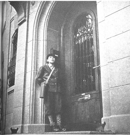
Die Hausfeuerwehr hat inzwischen ihre Posten bezogen, so dass sie alle Stockwerke in möglichst gesicherter Stellung überwachen kann. Links: der Beobachtungsposten vor der Haustür, rechts: Mitglieder der Hausfeuerwehr im Treppenhaus

Gemäss den Vorschriften wird bei Alarm das Fuhrwerk am Strassenrand angehalten und das Pferd abgeschirrt und hinten an den Wagen angebunden