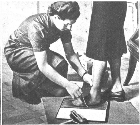
Links: Ein gesundes Unternehmen, das sich dauernd entwickelt, bildet in seiner Eigenart eine starke Stütze des Allgemeinwohls. — Oben Mitte: Absolute Präzisionsarbeit charakterisiert den Herstellungsprozess. — Oben rechts: Für besonders empfindliche Füße ist die Möglichkeit vorhanden, die plastische Innensohle nach dem eigenen Fussabdruck einzubauen