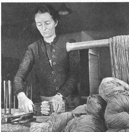
Die Strangen kommen in die Packerei und werden mit Strangenbändern versehen

In der heute so schweren Zeit, in der das Rohmaterial überall knapp wird, bedeutet jeder Textilfaden für unsere Volkswirtschaft reines Gold. Die Zwirneri in Burgdorf ist eine der ältesten ansässigen Betriebe und verdankt ihren Aufschwung der Arbeit von mehreren Generationen. Das Unternehmen ist bestrebt, mit dem zur Verfügung stehenden Material und den neuesten maschinellen Einrichtungen die zweckmässigsten Garne für das Wohl der Allgemeinheit zu fabrizieren