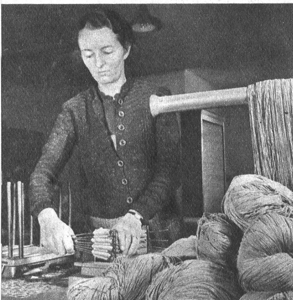
Die Strangen kommen in die Packerei und werden mit Strangenbändern versehen

In der heute so schweren Zeit, in der das Rohmaterial überall knapp wird, bedeutet jeder Textilfaden für unsere Volkswirtschaft reines Gold. Die Zwirnerie in Burgdorf ist eine der ältesten ansässigen Betriebe und verdankt ihren Aufschwung der Arbeit von mehreren Generationen. Das Unternehmen ist bestrebt, mit dem zur Verfügung stehenden Material und den neuesten maschinellen Einrichtungen die zweckmässigsten Garne für das Wohl der Allgemeinheit zu fabrizieren