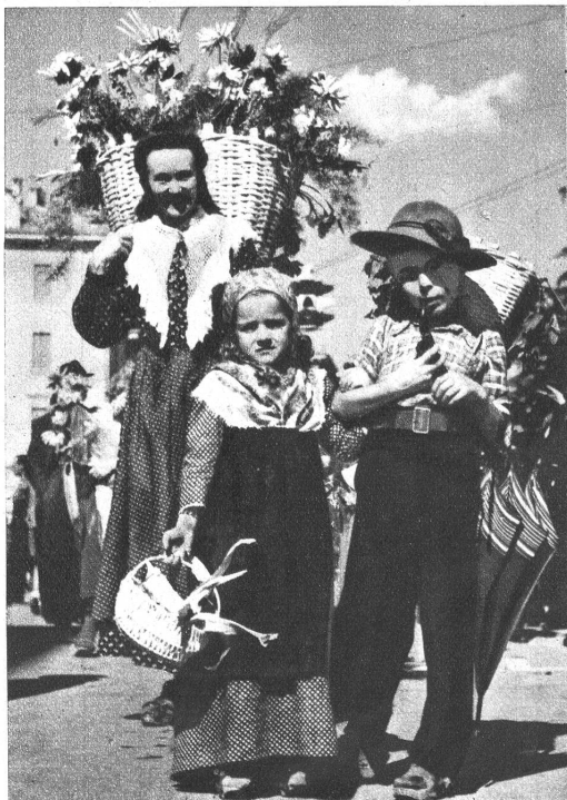
Die Schweizermesse in Lugano. Oben: Ein reizendes Tessiner Trio aus dem Festzug des Winterfestes in Lugano, der am Sonntag anlässlich der Fiera durchgeführt wurde. Rechts: Das Eingangsportal im Flaggenschmuck unter dem strahlend blauen Himmel des Südens