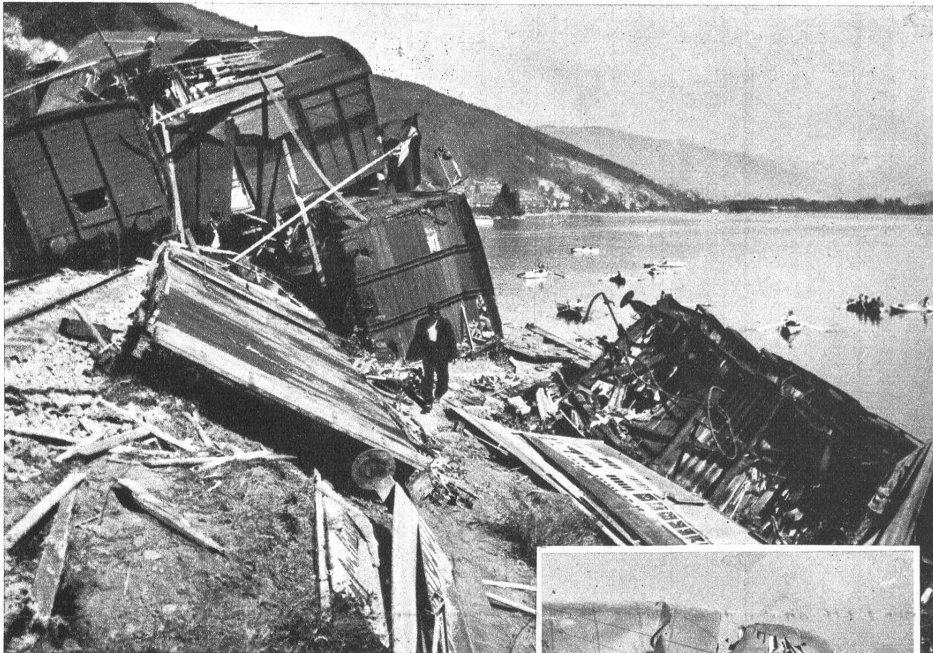
Rechts: Wie Zündholzschachteln zerdrückte Güterwagen, die zum Teil in den See hinunter stürzten