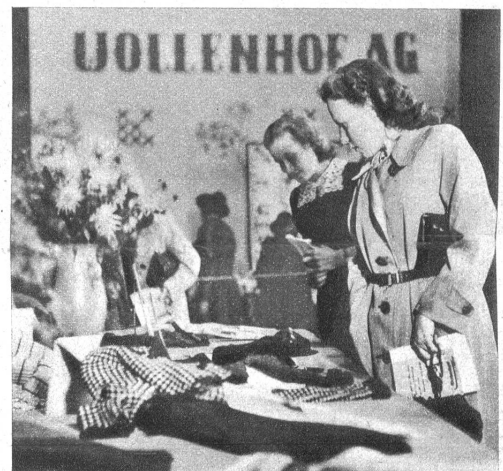
Die Besucherinnen bewunderten eingehend die ausgestellten Modelle. Zirka 8000 Personen haben die Ausstellung besucht

Trotz Rationierung und Rohmaterialverknappung ist Wolle in allen neuzeitlichen Farben und in allen neuen Modellen bei der Ausstellung im Casinc zur vollen Geltung gebracht worden. Angefangen von den kleinsten Dingen für Kinder bis zum raffiniertesten Pullover für Damen und Herren, überall zeigten sich die gute Auswahl, Geschmack und schöne Ausführung der Modelle. Es war für die Besucher eine Augenweide, die Fülle der ausgestellten Kollektionen bewundern zu können, bei welcher Gelegenheit die belehrende Aufklärung, der Sinn der Ausstellung deutlich zum Ausdruck kam.