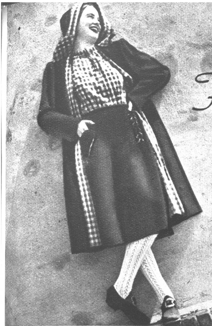
Brauner Mantel mit Kapuze und ebensolchem Rock und rotweiss kariertem Futter im Mantel. Die Bluse ist aus dem gleichen Material