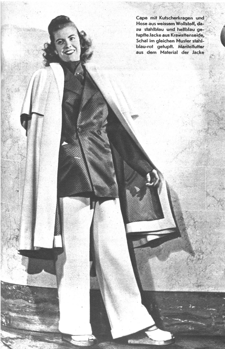
Cape mit Kutscherkragen und Hose aus weissem Wollstoff, dazu stahlblau und hellblau getupfte Jacke aus Krawattenseide, Schal im gleichen Muster stahlblau-rot getupft. Mantelfutter aus dem Material der Jacke

In unseren arbeitsreichen Tagen, die mit der Sorge um das tägliche Brot ausgefüllt sind, winkt auch etwas Ferienzeit in den harten Arbeitsrhythmus hinein. Wenn man also ausspannt, dann sicher vollkommen,