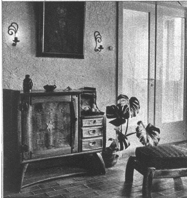
Ein typisches Beispiel, wie ein Ziermöbel durch ein praktisches und formschönes Modell ersetzt werden kann