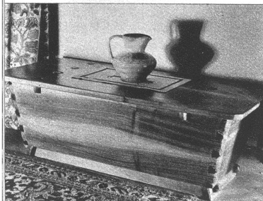
Auch in moderner Form wirkt eine Truhe heilig und gibt der Wohnung den Ausdruck besonderer Behaglichkeit