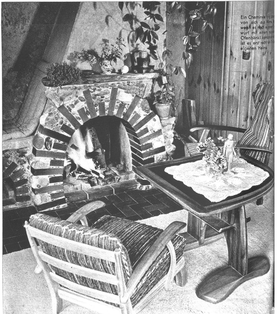
Ein Cheminée, das sich von sich aus harmonisiert, wenn es sich mit einem Ofenwürf mit einem kleinen Ofenbänkli kombiniert, ist es erst recht ein Teil des eigenen Heims