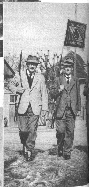
Auf zum Neuenegg Schieszen