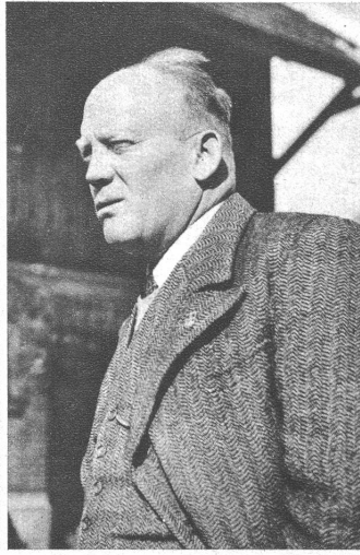
Der Oberschützenmeister der Scharfschützen Bern