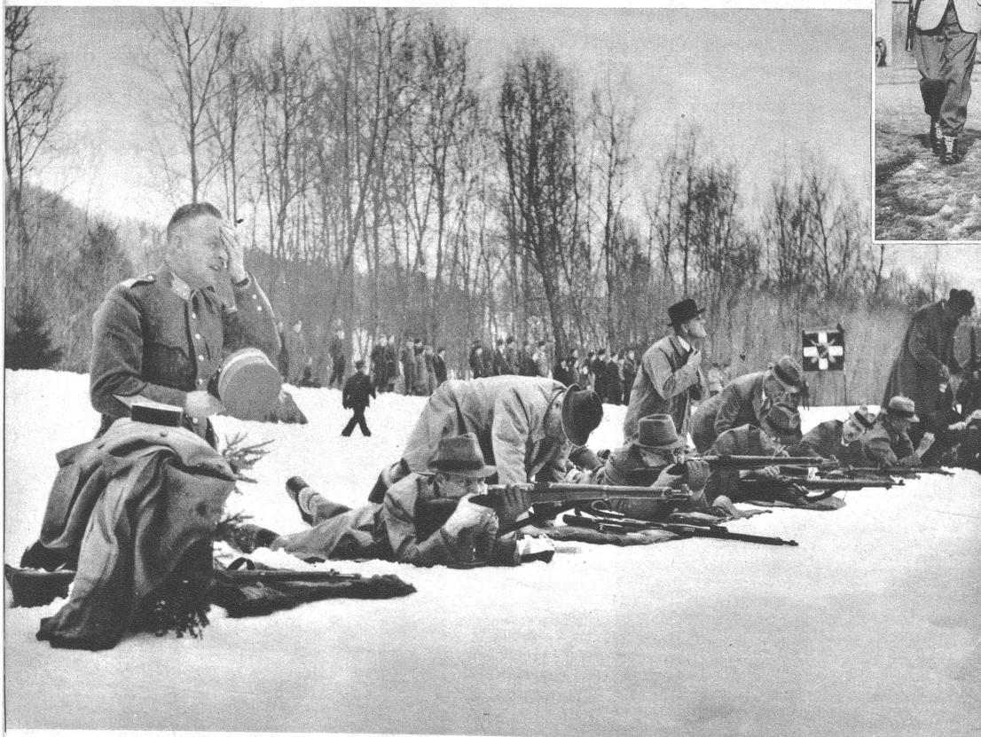
Hochbetrieb bei Scharfschützen. Punkt zählt. Da es trotz dem Sch warm