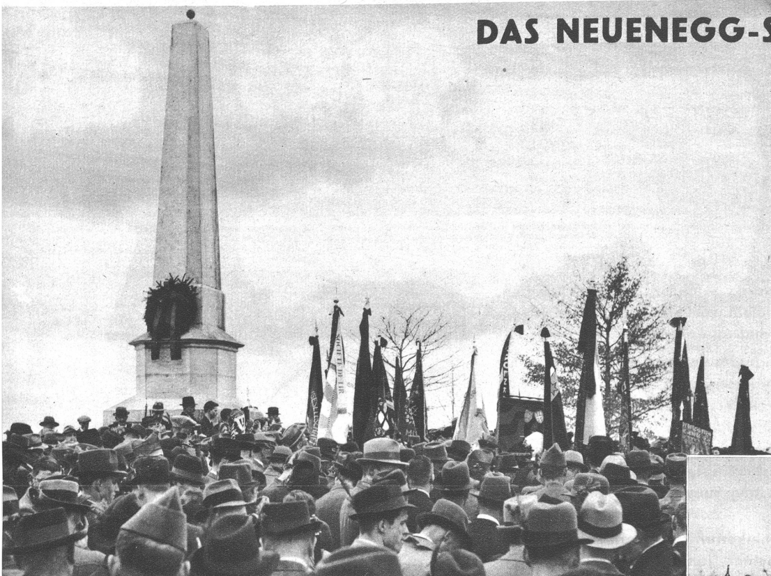
Historische Gedenkfeier beim Neuenegg-Denkmal