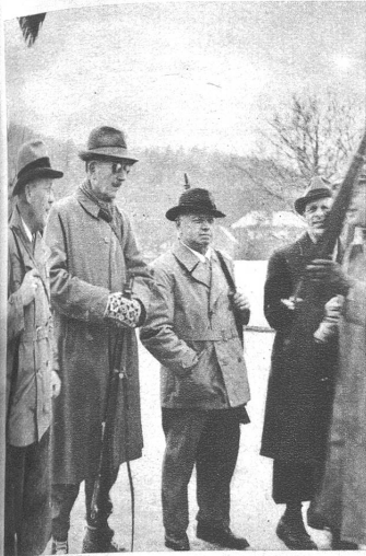
Schnell werden noch die letzten Instruktionen der Schützenmeisters zur Kenntnis genommen