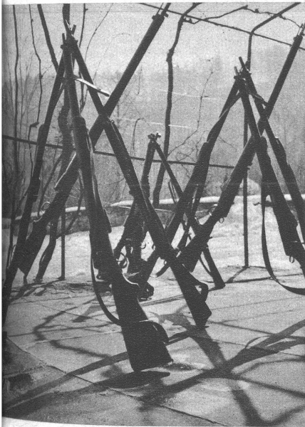
Links: Die Gewehre reden ihre eigene Sprache