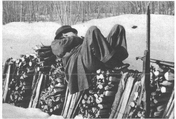
Rechts: Ein kurzes „Nickerchen“ vor dem Schiessen