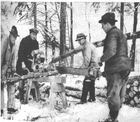
Eine durch einen Benzinmotor betriebene Kettensäge zerkleinert die Stämme