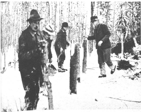
Ein Eschenbaumbestand, etwa einen Meter über dem Boden sind die Stämme abgesägt worden. Der Rest wird nun durch einen Traktor mit Seilwinde samt Wurzeln ausgezogen