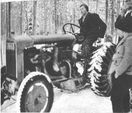
An diesem Traktor befindet sich ein Drahtseil, welches dann die Eschenstöcke ausreisst