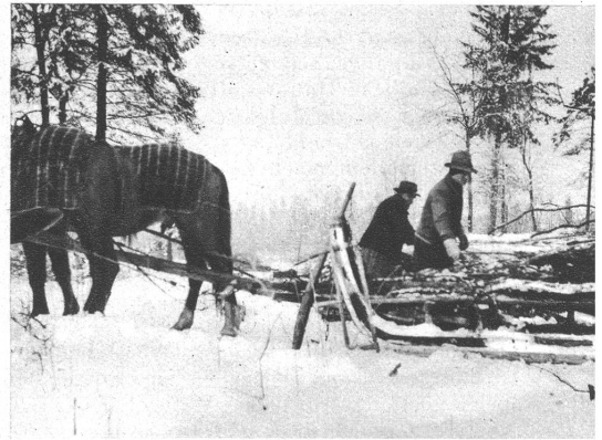
Der gute „Schleif“ kommt den Bauern jetzt zum Holzführen sehr gelegen