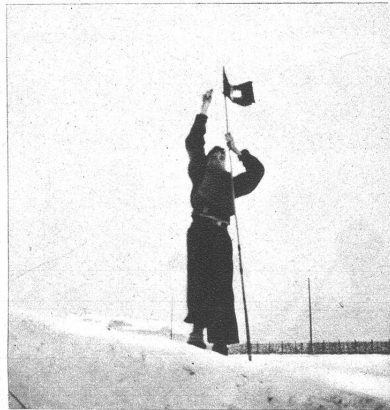
Der junge Erbauer, Kapitän und Besitzer des stolzen Schiffes hisst die Fahne

Nach Beendigung der Übungen, die etwa 4–5 Tage dauern, werden die aufgebotenen Truppen, Pferde und Motorfahrzeuge wieder nach Hause entlassen.