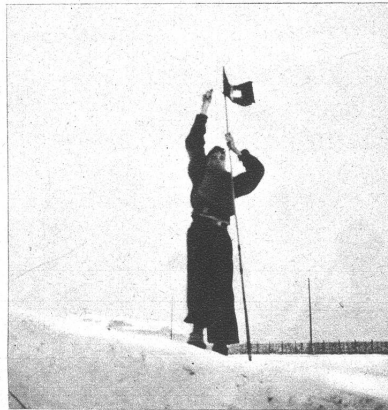
Der junge Erbauer, Kapitän und Besitzer des stolzen Schiffes hisst die Fahne