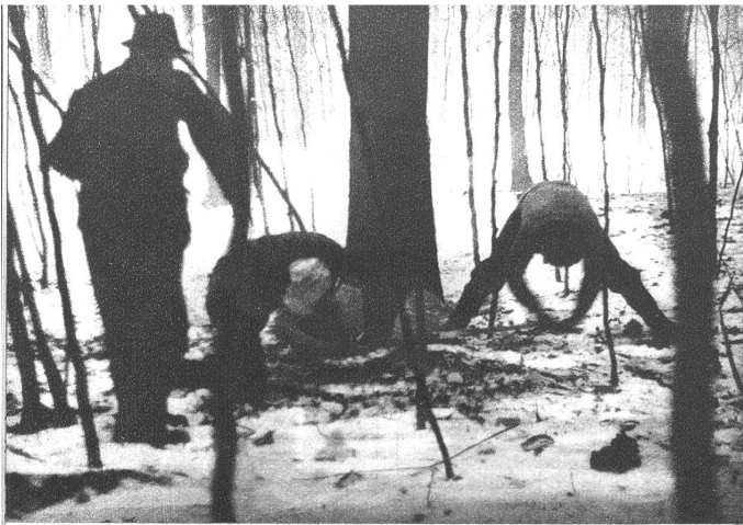
Die vom Förster zum Schlagen frei gegebenen Bäume werden bezeichnet, nummeriert und erst dann abgeholzt