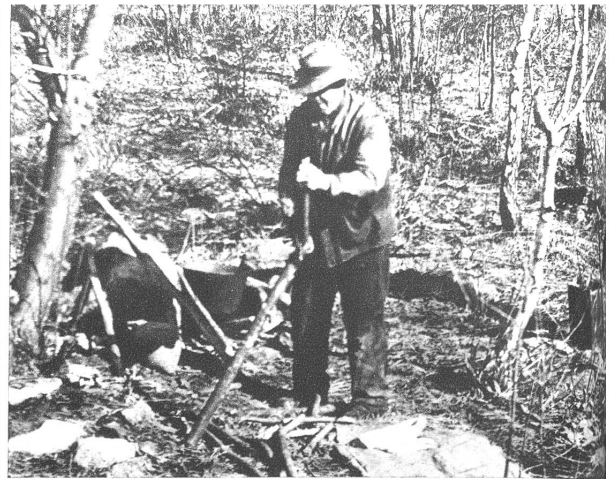
Die Rodung des Kleinholzes wird durch die Hilfskräfte besorgt und man kann sich damit noch ein paar Batzen verdienen