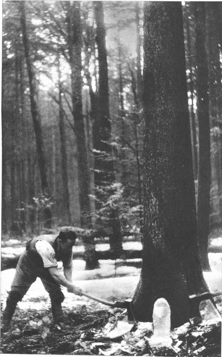
Das Schlagen der Bäume erfordert Sachkenntnis, Kraft und viel Geschicklichkeit, denn das Fallen der Bäume wird im voraus bestimmt und berechnet, damit das Jungholz nicht beschädigt wird