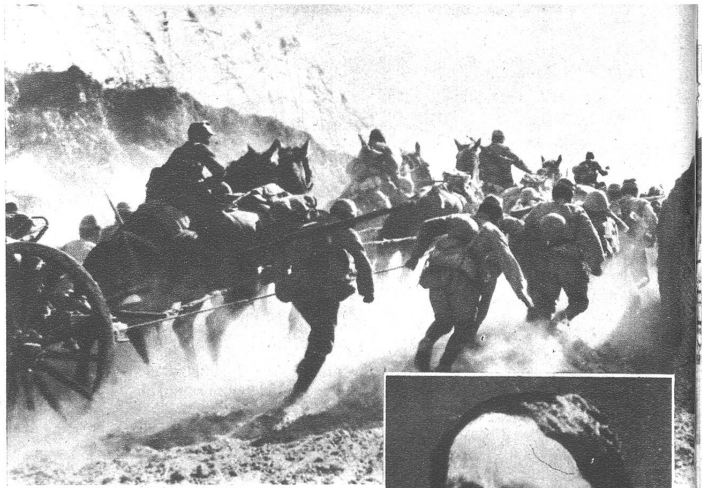
Vorrückende japanische Feldartillerie