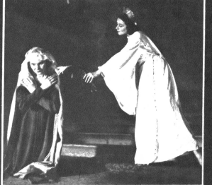
Rechts: Läufe alle zumal mit Feuerschein Soll nach Bethlehem zum Krippland, zum Krippland im Stall