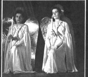
Rechts: Der Chor der Engel begleitet das Weihnachtspiel