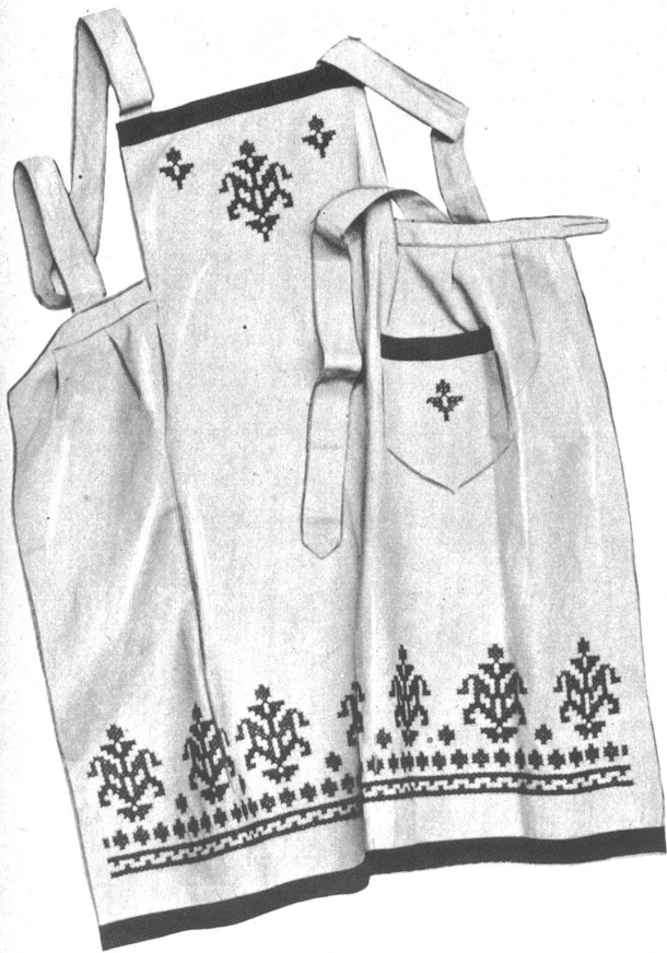
Schürze, Repsstoff, beige mit braun garniert, Kreuzstichbordüre in rot und braun Similan gestickt