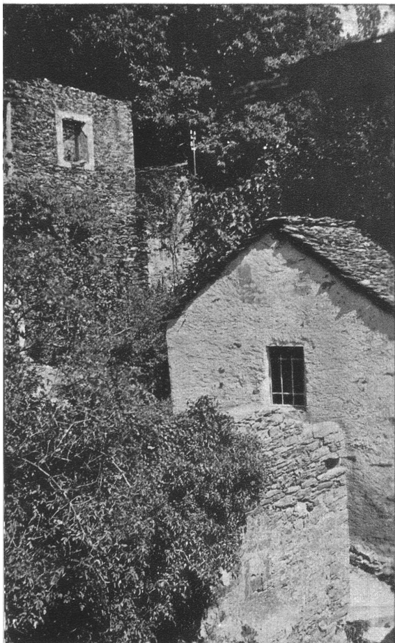
Halbzerfallene Häuser, von wildem Gestrüpp und Unkraut überwuchert, ragen aus dem Grün des steilen Hanges.

Von der Strasse aus, die am See unten nach Brissago führt, sieht Fontana-Martina wie ein altes Räubernest aus.