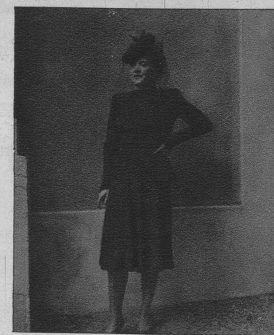
Schwarzes Nachmittagskleid mit Plisségarnitur, die man abnehmen kann. Dazu ein kleiner, schwarzer Haarfilzhut in Toleroform mit einem netten Schleier.

Dieses Abendkleid aus dunkel und hellmauve Crêpe wirkt nicht nur durch die schöne Linie, sondern auch durch die harmonische Farbstimmung.