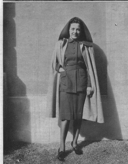
Ein Herbstensemble — reizvoll, neuartig und wirkungsvoll. Dunkelbraunes, sportliches Jackettkleid, kombiniert mit einem helleren, dunkelbraun abgefütterten Cape und Kapuze.

Eine lange, weite Hose, dazu ein passendes Kamelhaargilet und eine schöne, weisse Pelzjacke mit Kapuze, bilden ein Sportensemble, das nicht streng, aber elegant wirkt.