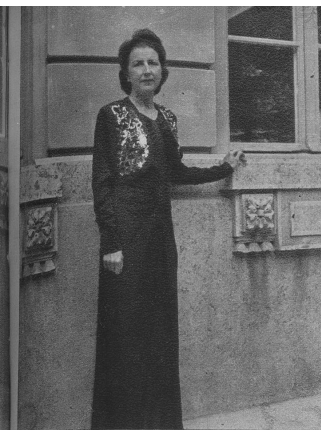
Elegantes schwarzes Abendkleid mit reicher Goldstickerei auf dem Bolero. Die Linie des Modells überrascht durch einfache Eleganz.