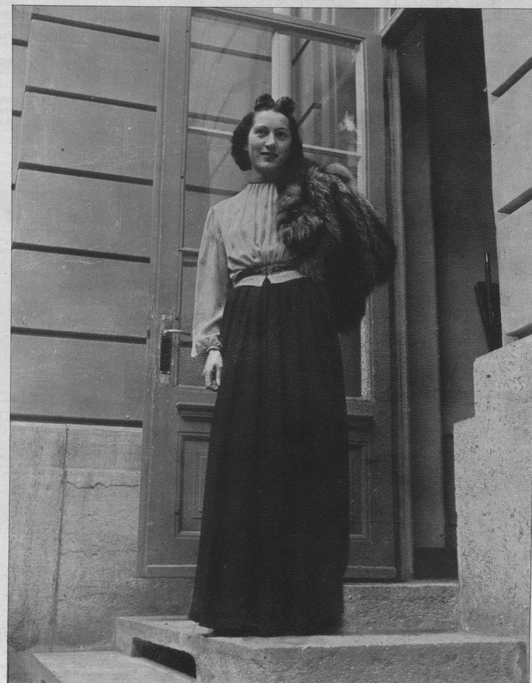
Besonders reich wirkt dieses Modell — schwarzer Rock und Georgettebluse in Königsblau mit Stickerei. Die Farben und die Garnitur verleihen dem Kleid eine wirklich vornehme Wirkung.