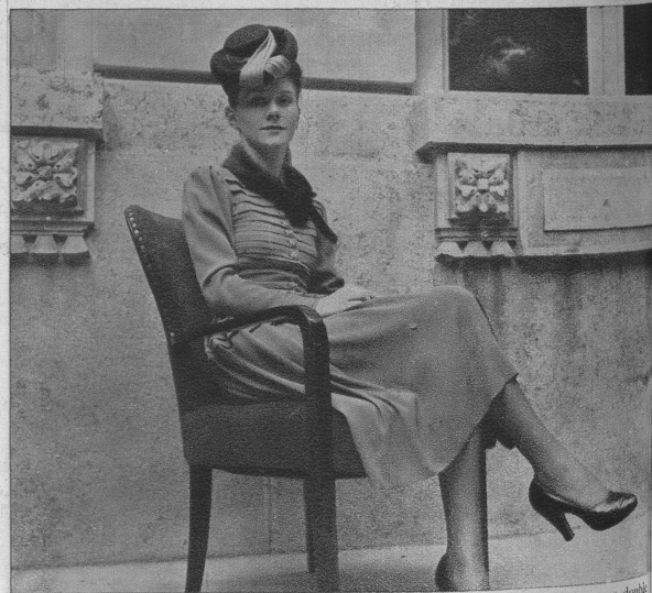
Ein reizendes Nachmittagskleid und dazu passend ein schicker Hut — brauner doppelter Bord Feutre mit lindenblütenfarbiger Georgettegarnitur, der ausnehmend gut kleidet.