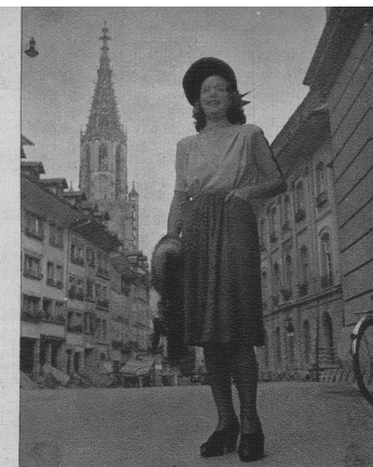
Seiden-Nachmittagskleid in zwei Kontrastfarben und interessanten Seitentaschen. Der Marderpelz unterstreicht die gefällige Linie des Kleidchens.