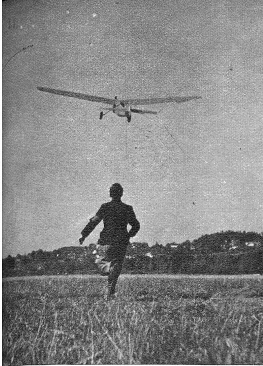
Start aus der Hand. Eben erhebt sich die Maschine und gewinnt an Höhe.