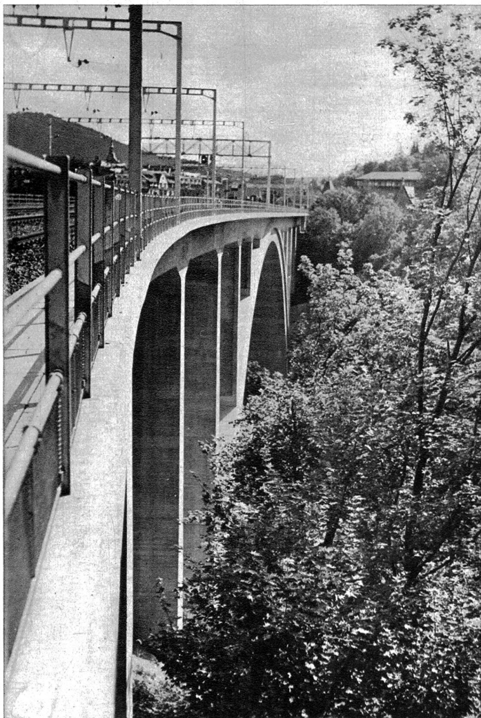
Formschön passt sich die neue Eisenbahnbrücke in die natürliche Umgebung ein.