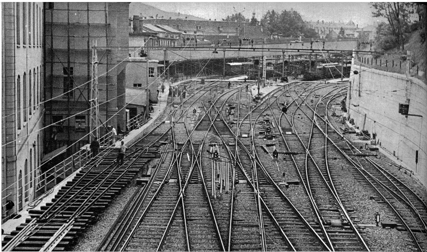
Die imposante neue Einfahrt in den Berner Bahnhof. Die feierliche Eröffnung der neuen vierspurigen Eisenbahnstrecke Bern-Wylerfeld findet heute statt.