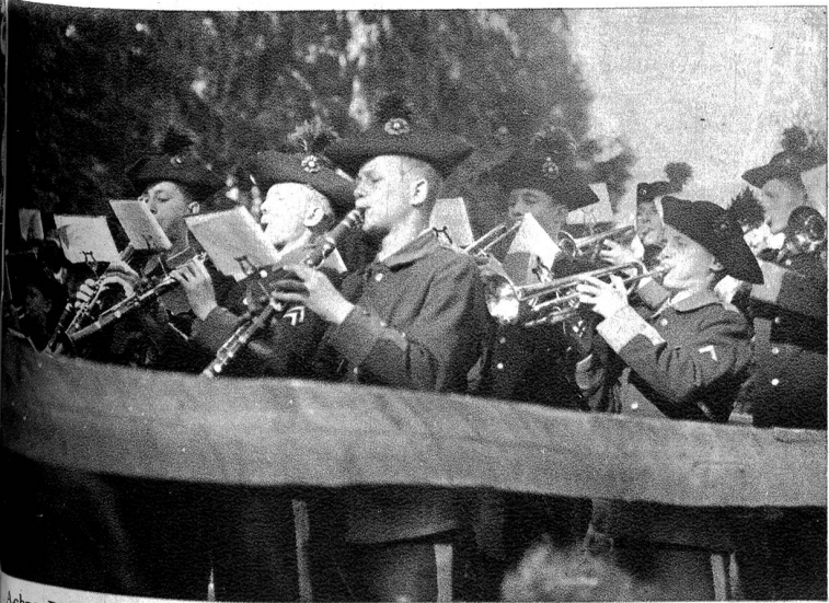
Achzig Buebe vo der Knabenmusik Bärn hei dene Hammegeglüt bis i d'Nacht die blase, piffe u trummet.