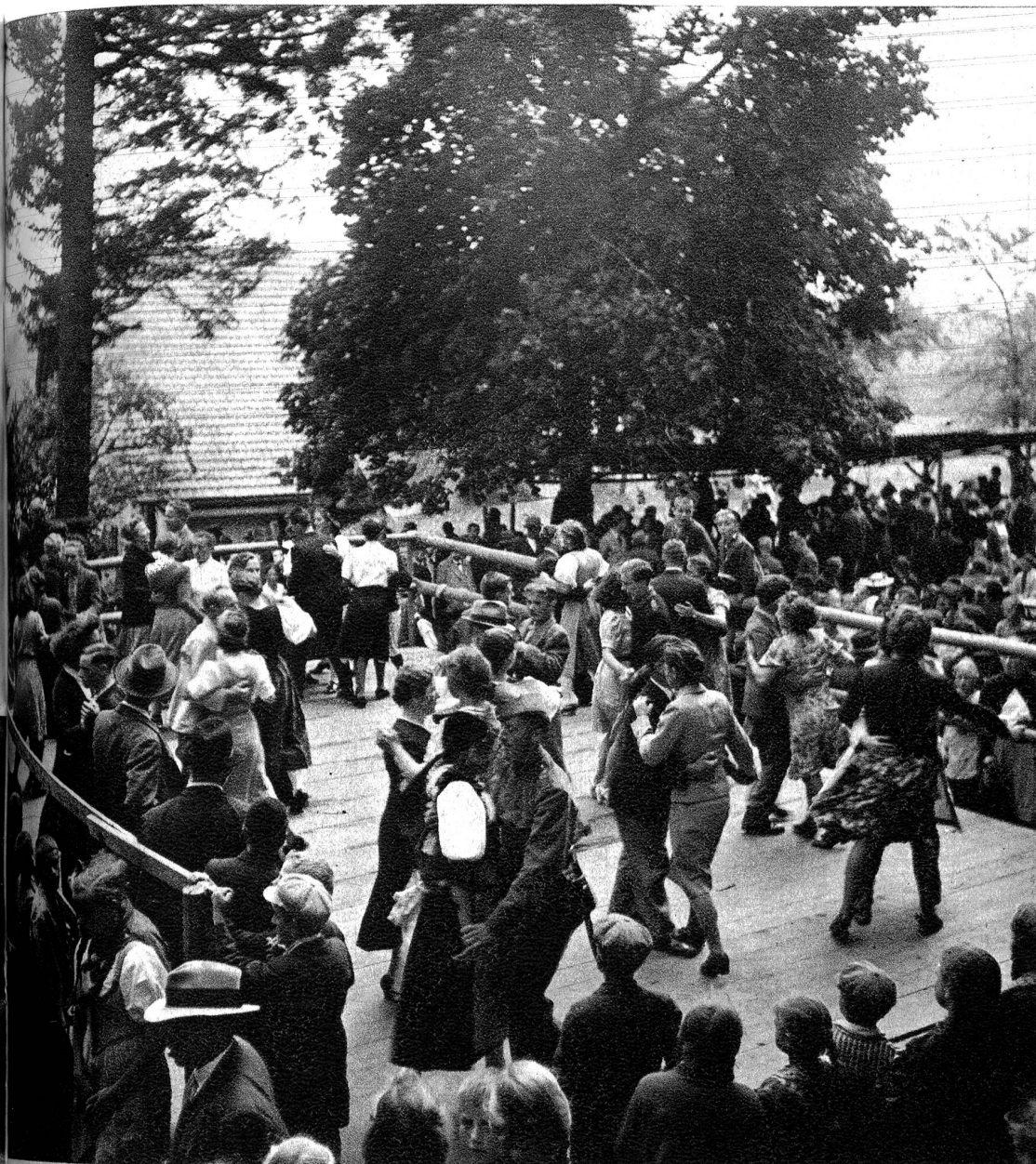
Mits uf em Hammegebbode hei si e Tanzbode ufgmacht. Buebe u Meitschi hei gwalzeret u die Alte, wo zuegluegt hei, sie still vergnuegt bi ihrem Glesli ghocket.