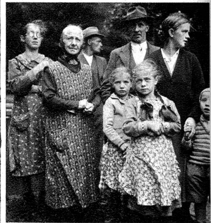
Bruggbachlüt si der stotzig Rain ufe cho u freue sech über d'Jödeler u d'Buebe us der Stadt.