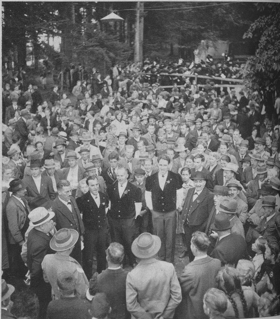
Halblinig isch ds Chörli „Daheim“ uf der Hammeegg obe agrückt. Si hei zwirbelet, tanzet u dene Burelüt, wo i dene Chräche um d'Hammeegg ume wohne, gjödelet und gsunge.