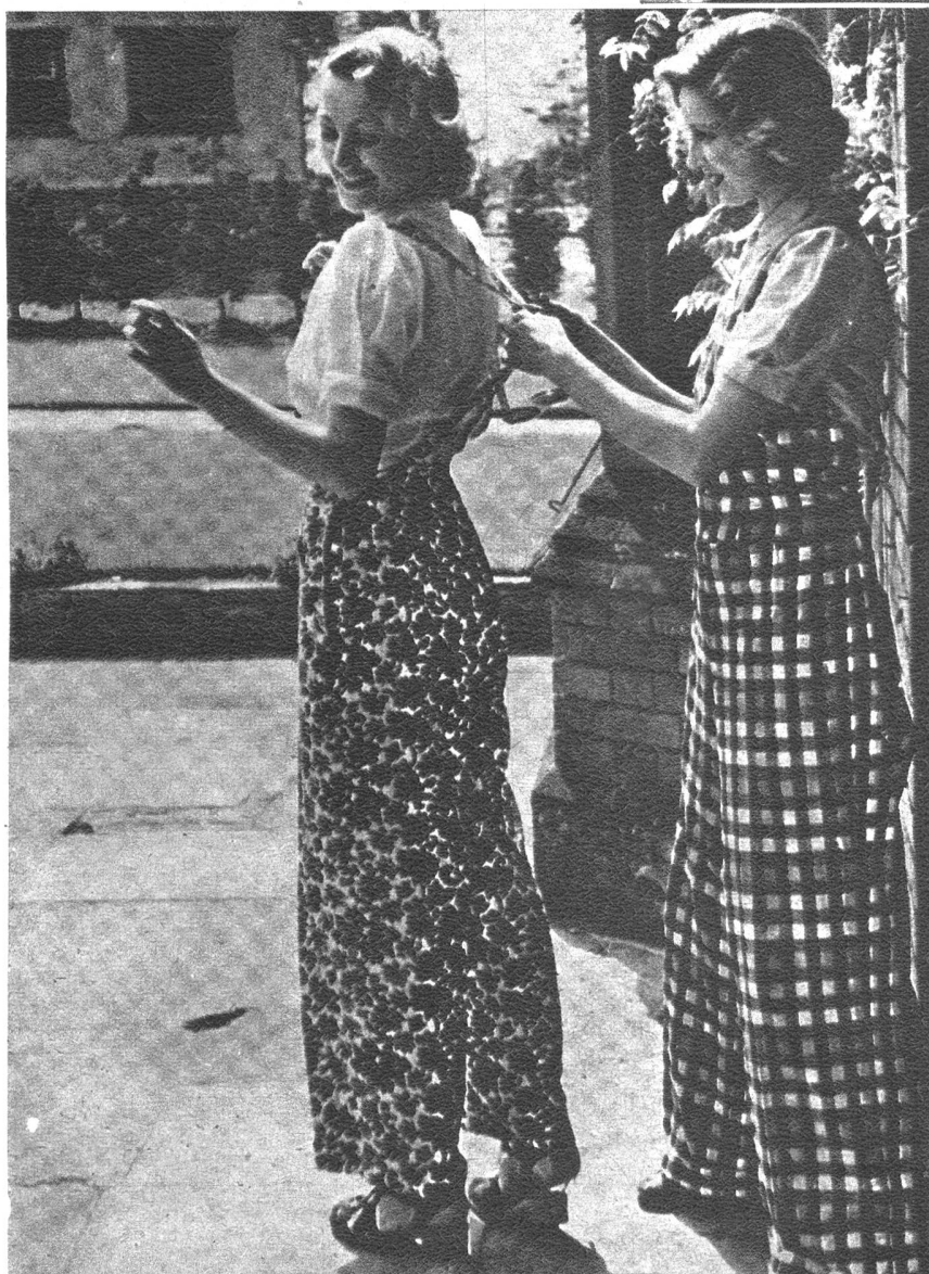
Lange Hosen zu Hause bieten immer noch die beste Bewegungsfreiheit, was in der heutigen Zeit wirklich Notwendigkeit geworden ist. Was aber zu Hause gut ist, passt nicht immer auf die Strasse — also Vorsicht im Geschmack.