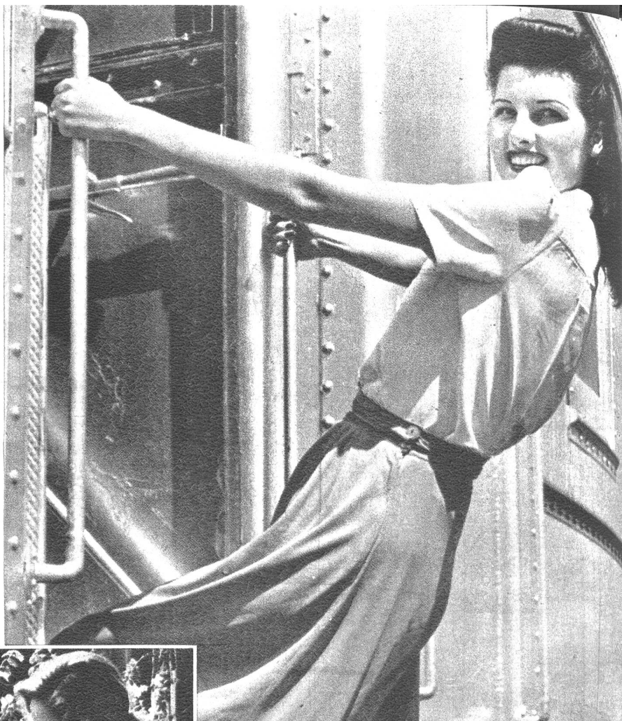
Légère und doch kleidsam wirkt ein gut gewähltes Kleid, welches die Strapazen der Reise leicht erträgt. Tricotsachen, Baumwolle, Seide und Wolle lassen der Phantasie genügend Raum, wo die Kleiderkarte dies noch zulässt.

Der Schnitt ist durchwegs lang und reicht bis zu den Knöcheln. Oben ist das Kleid eng anliegend, um bis zum Saum in eine angenehme Weite auszulaufen. Die Farbe und das Muster spielen natürlich eine grosse Rolle, und jede Frau wählt nach ihrem Geschmack das, was ihr eigentlich gut passt. Man trifft schöne Unimodelle an, bei denen der Stoffreichtum ganz besonders zur Wirkung gebracht wird. Solche Stücke verziert man diskret mit einfachen aber doch schönen Motiven, um die Eintönigkeit der grossen Stofffläche abzuschwächen. Daneben sieht man Streifenmuster im Herrenschnitt, die an Gefälligkeit in keiner Weise nachstehen. Diese Modelle wirken natürlich wie fertige Kleider und geben der Frau im Hause das Gefühl, wirklich gut und komplett angezogen zu sein. Gerade dieser Wirkung wegen soll in den Hauskleidern eine gewisse, man möchte sagen, autoritative Note nicht ausser acht gelassen werden, denn durch die Auswahl zu bunter und scheckiger Stoffe geht die eigentliche Wirkung des Hauskleides verloren und mahnt mehr an den Morgenrock oder an typische Kleidungsstücke, in denen die Frau nicht als ganz angezogen wirkt.